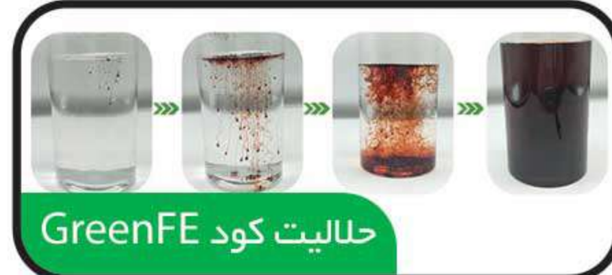
حلالیت کود GreenFE