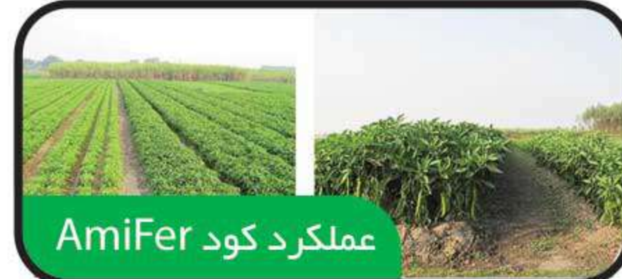
عملکرد کود AmiFer