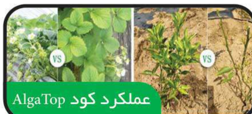
عملکرد کود AlgaTop