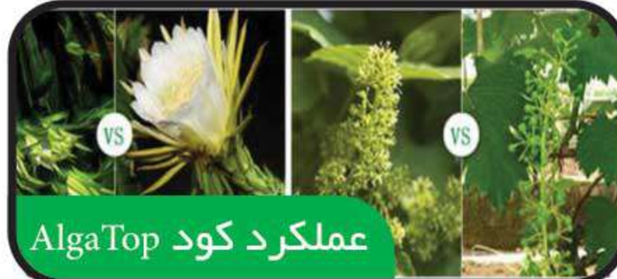
عملکرد کود AlgaTop