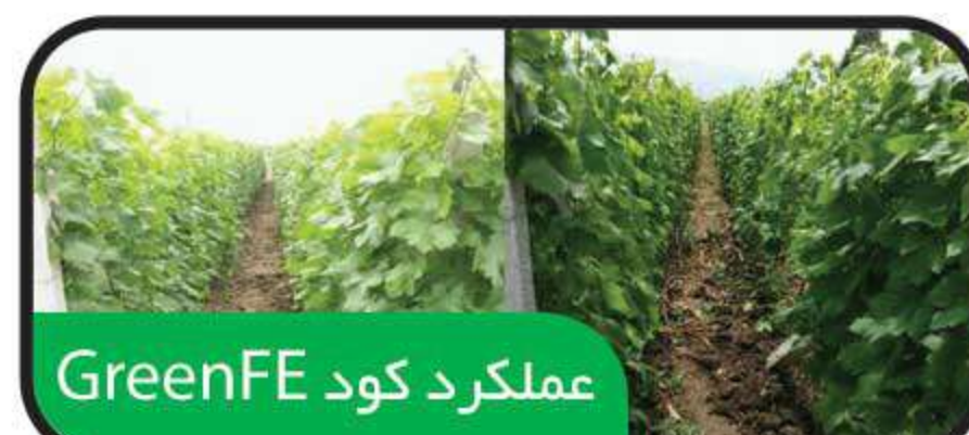
عملکرد کود GreenFE