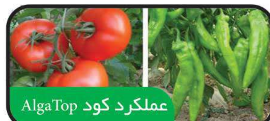
عملکرد کود AlgaTop